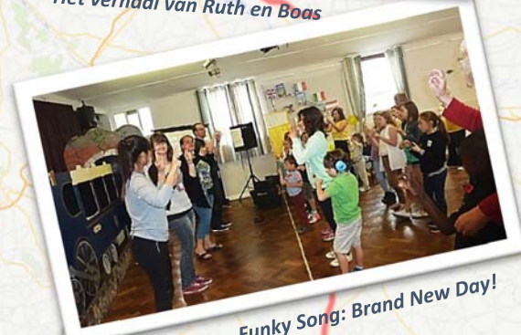
Funky Song: Brand New Day!