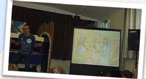
Het verhaal van Ruth en Boas